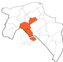
Regio Samenwerkingsverband VO 20.01 Stad Groningen (Groningen, Haren, Ten Boer en Zuidlaren)

Voor algemene informatie over Passend Onderwijs kunt u terecht op de website van het Ministerie van OCW: www.passendonderwijs.nl . Op deze site vindt u o.a. ook veelgestelde vragen door ouders en scholen .